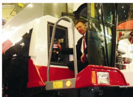
Установка насоса на комбайне acros 530/540

Совместно с ООО «Ростсельмаш» нашей компанией были разработаны и испытаны АЦСС практически для всех новых моделей комбайнов. Расход и распределение смазочного вещества по парам трения, согласно их потребности, производится через прогрессивные распределители. Согласно предложенной схеме смазки, каждая пара трения во время работы комбайна один раз в час получает заданное ей количество смазочного вещества. Однако блок управления, встроенный в насос, достаточно просто и быстро позволяет изменить режим смазки и подобрать любой другой.